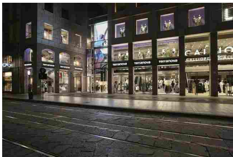
Store Terranova e Calliope a Milano

Il Gruppo Teddy , azienda italiana attiva nel fast fashion con i brand Terranova, Rinascimento, Calliope e Miss Miss, sta portando avanti un piano di aperture retail che prevede l'inaugurazione di 100 punti vendita nel mondo nel 2017, in linea con quanto avvenuto nel 2016. Obiettivo della società è di raggiungere grazie a questa strategia i 900 milioni di euro di fatturato nel 2019.